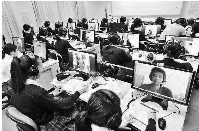
英会話の授業で、インターネット電話を使ってフィリピンにいる講師と話す生徒たち。入試も英語重視に見直した(東京都千代田区の麹町学園女子中学校で)